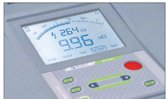
Un affichage panoramique, avec rétro-éclairage pour une lisibilité parfaite.

Facilité d'utilisation: la valise avec sangle permet une utilisation aisée sur les équipements à tester et un branchement facilité. Le MI3201 est conçu pour les environnements difficiles.